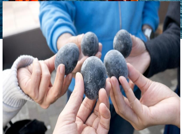
ไปชิม ไข่ดำ หุ บ เขาโอ

Highlight! โดยชาวญี่ปุ่นมีความเชื่อว่า เมื่อกินไข่ดำ 1 ฟอง จะทำให้มีอายุยืนยาวขึ้น 7 ปี ไม่ลองไม่ได้แล้ว!